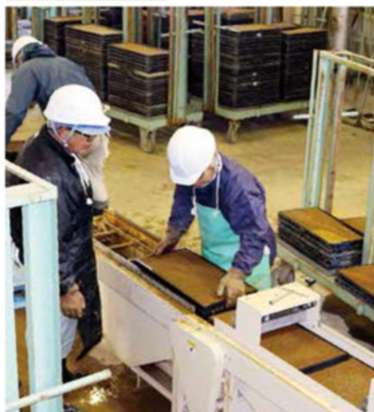
井口育苗センター「ゆめみづほ」播種の様子