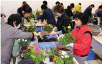
出来上がりを予想して配置しました