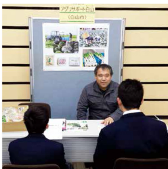
相談者にわかりやすく説明する担当者

当日のブースには、就農に前向きな方が訪れ、熱心に話を聞かれていました。また、就業セミナーに聞き入る方も多く、農業への関心が高まっていると感じられました。