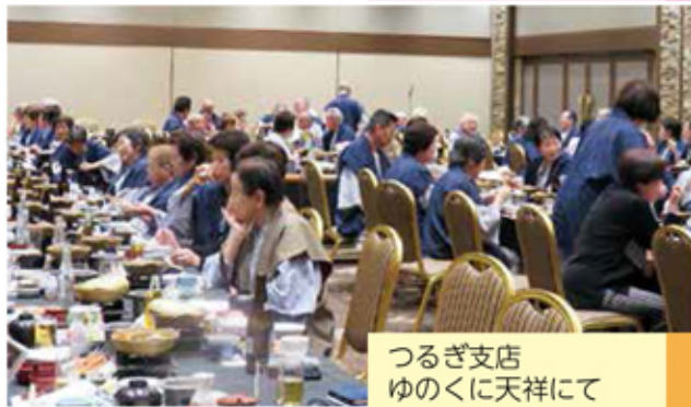
つるぎ支店 ゆのくに天祥にて