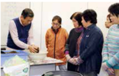
苗の高さが揃うよう、土を入れて調節します