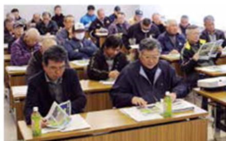
熱心に講習に聞き入る参加者

組合員や認定農業者32名の参加で繁忙期前のこの時期、農作業事故防止のために、事故の実態と農業機械を安全に乗るための点検や服装など、改めて安全への意識を高めるための講習会でした。最後に担当者が「基本操作を守り、心に余裕を持って操作をすること。定期的な点検を行い機械の状況を把握することが安全に繋がる」と、安全運転で今年も作業することを確認しました。 展示会には2日間で100名を超えるお客様にご来場いただきました。