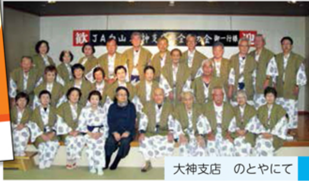
大神支店 のとやにて

親睦を深めていただき、カラオケ大会も大変盛り上がりました。年金友の会では、毎年温泉旅行をはじめ、健康ウォーキング、グラウンドゴルフ大会、ゴルフ大会、コンサート招待など各種イベントを行っています。また、定期貯金優遇金利や受給感謝粗品プレゼントなど様々な特典を用意しています。年金手続きの際はぜひ最寄りの支店へご相談ください。