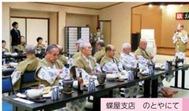
蝶屋支店 のとやにて

各会場ではJA役員と支部友の会会長が挨拶後、支店長から平成30年度の年金友の会活動を報告しました。その後の懇親会では