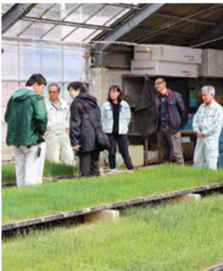
葉の伸び具合や色などを見て、定植時期を決めます。

今年度の作付面積は昨年より0.4 ha多い6 haを予定しており、ブランド化への定着と収量拡大、品質向上に向け改めて意思統一を図りました。