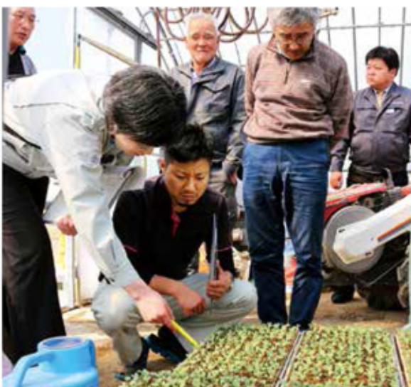
良品質な農産物のために、苗からしっかり管理しています

巡回を重ね、生育状況を部会で共有することで良品質で安定生産につなげ、農業者の所得増大を目指しています。