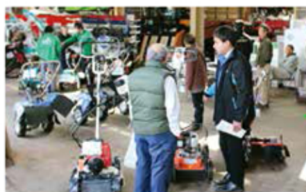
来場者で賑わう展示会場