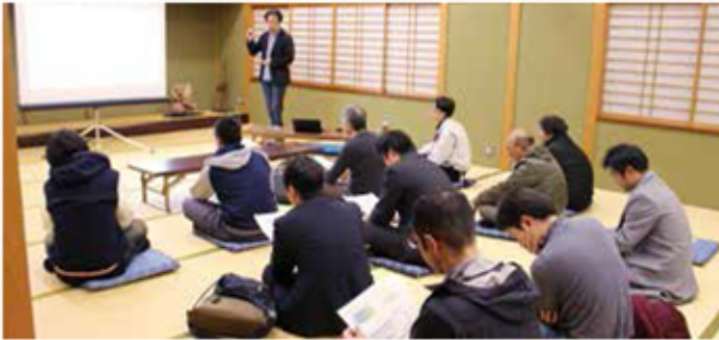
熱心に講義を聞く盟友