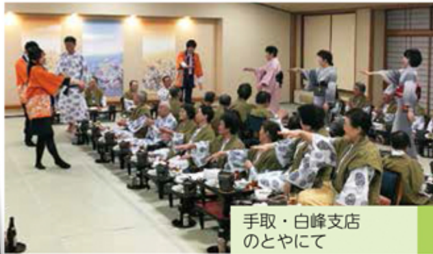
手取・白峰支店 のとやにて