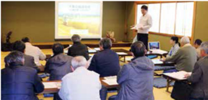
米収穫後、大麦栽培の準備が始まります

JAでは今後も現地栽培指導などを開催し、スムーズで効率的な作業が行えるよう、生産者への理解促進を図ります。