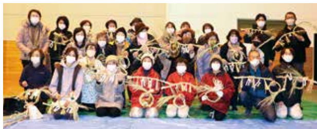
しめ縄づくり講習会