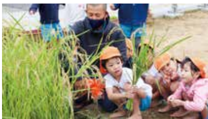
あいわこども園稲刈り