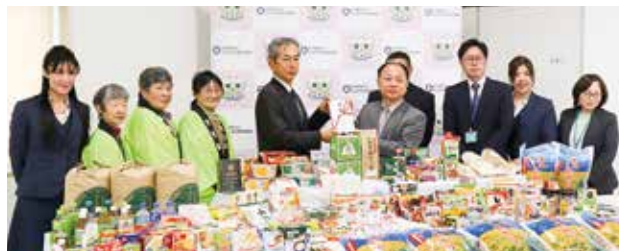
フードドライブ活動