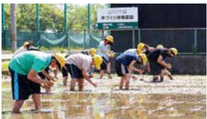
田んぼの学校（田植え）