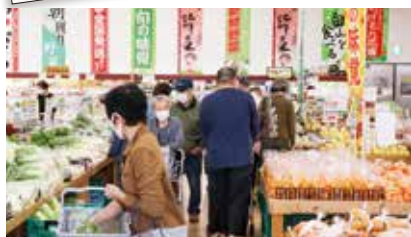
よらんかいねえ広場（農産物直売）