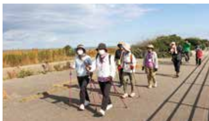
美川浜風健康ウォーキング