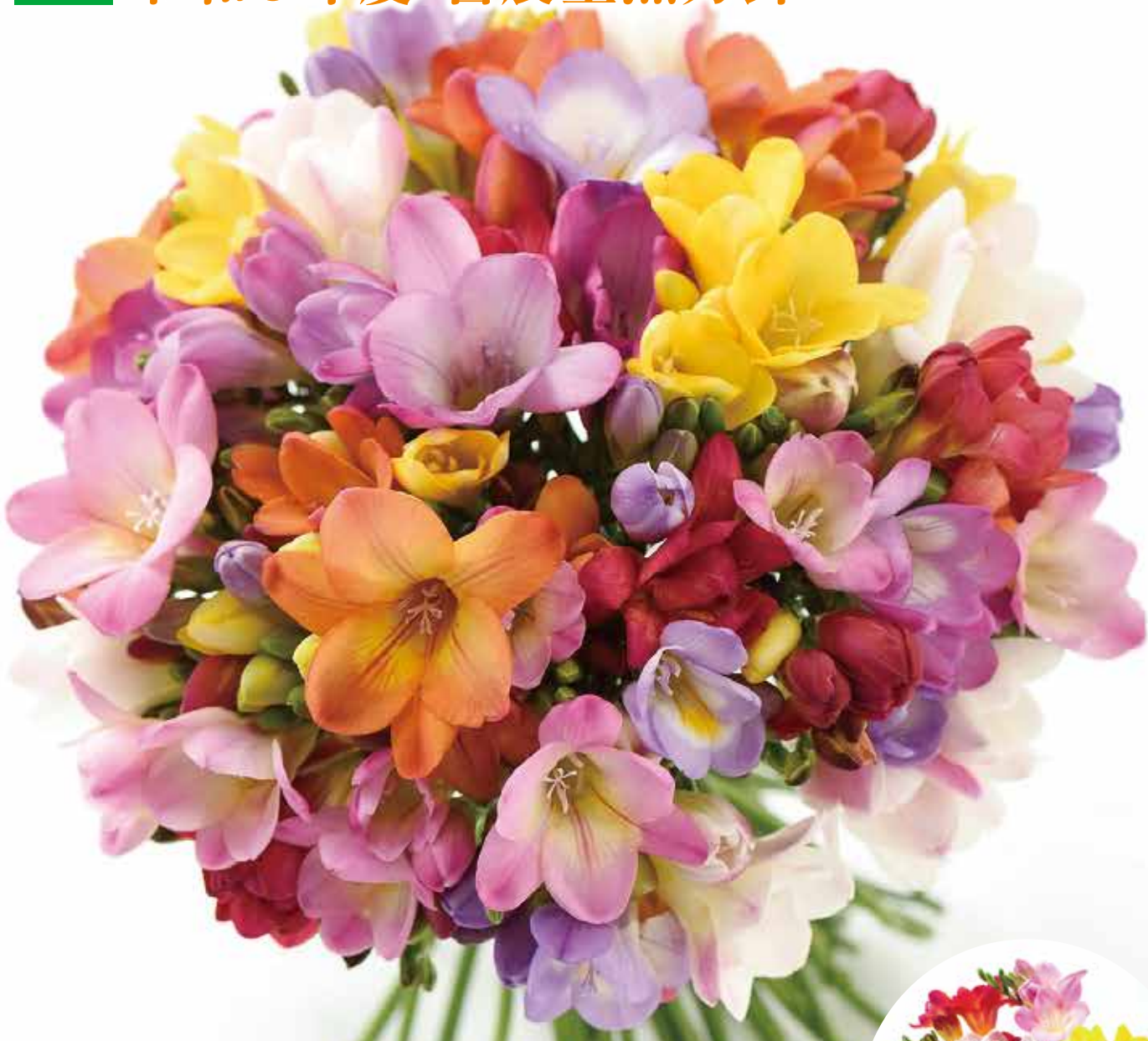
表紙の写真 エアリーフローラ 花言葉は「希望」

「エアリーフローラ」は石川県が8年の歳月をかけて開発したフリージアの新品種です。「エアリーフローラ」はピーチ、レッド、オレンジ、ローズ、イエロー、ピンク、パープル、シルク、シェルピンク、サンセット、ホワイトの11色もカラーバリエーションがあり、キャッチフレーズである「旅立ちを祝う花」として卒業式や入学式など新たな旅立ちのお祝いにお勧めです。