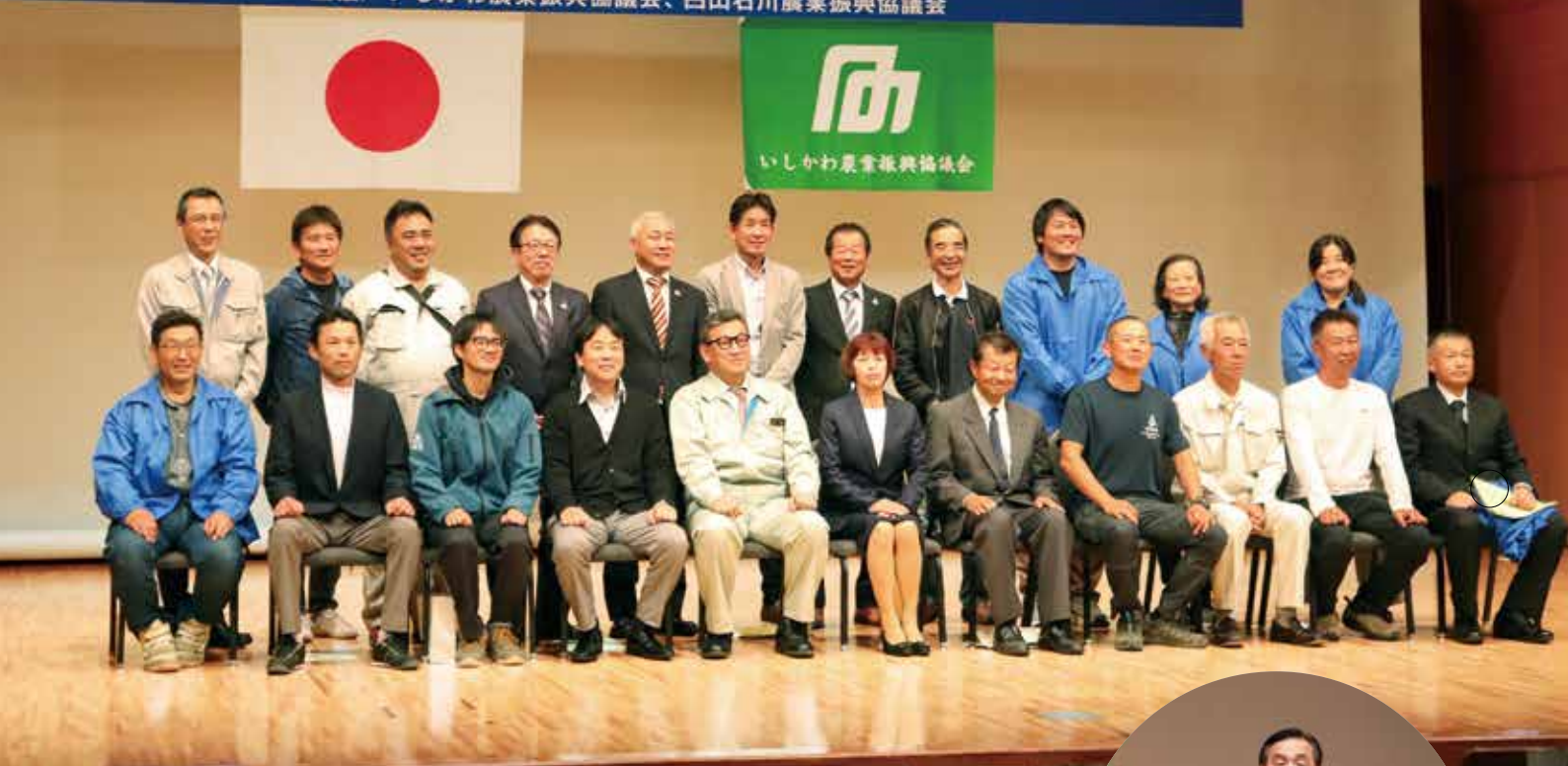
表紙の写真 第42回知事を囲む農政現地懇談会 松任学習センター コンサートホール