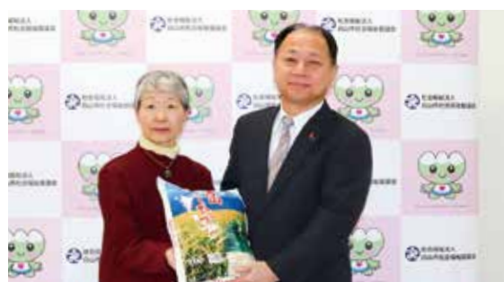
愛の助け合い運動