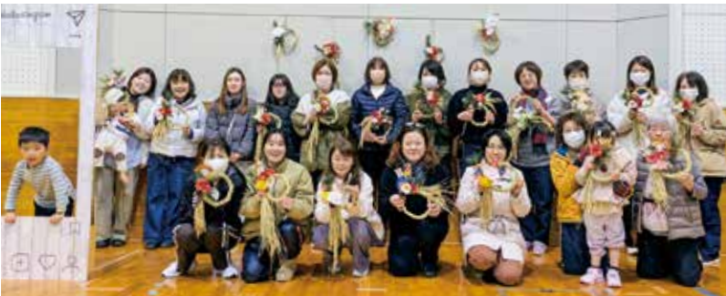
食×農×体験スクールの皆さん